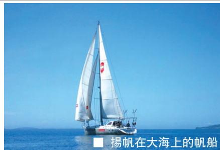
揚帆在大海上的帆船