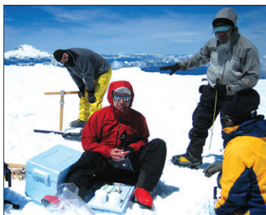
■ 薩濱與科學家一起做研究

責擔保，在歐洲、中國、波利尼西亞、澳洲、南美各選1至2名青年到瑞士參加環保討論會。凡希望獲得此次機會的青年，只需按規定寫4頁的文章遞交，即可有機會贏得這次難得的機會，在瑞士將參加為期2周的一系列活動，包括很多運動項目，包括滑雪、帆船、登山等。