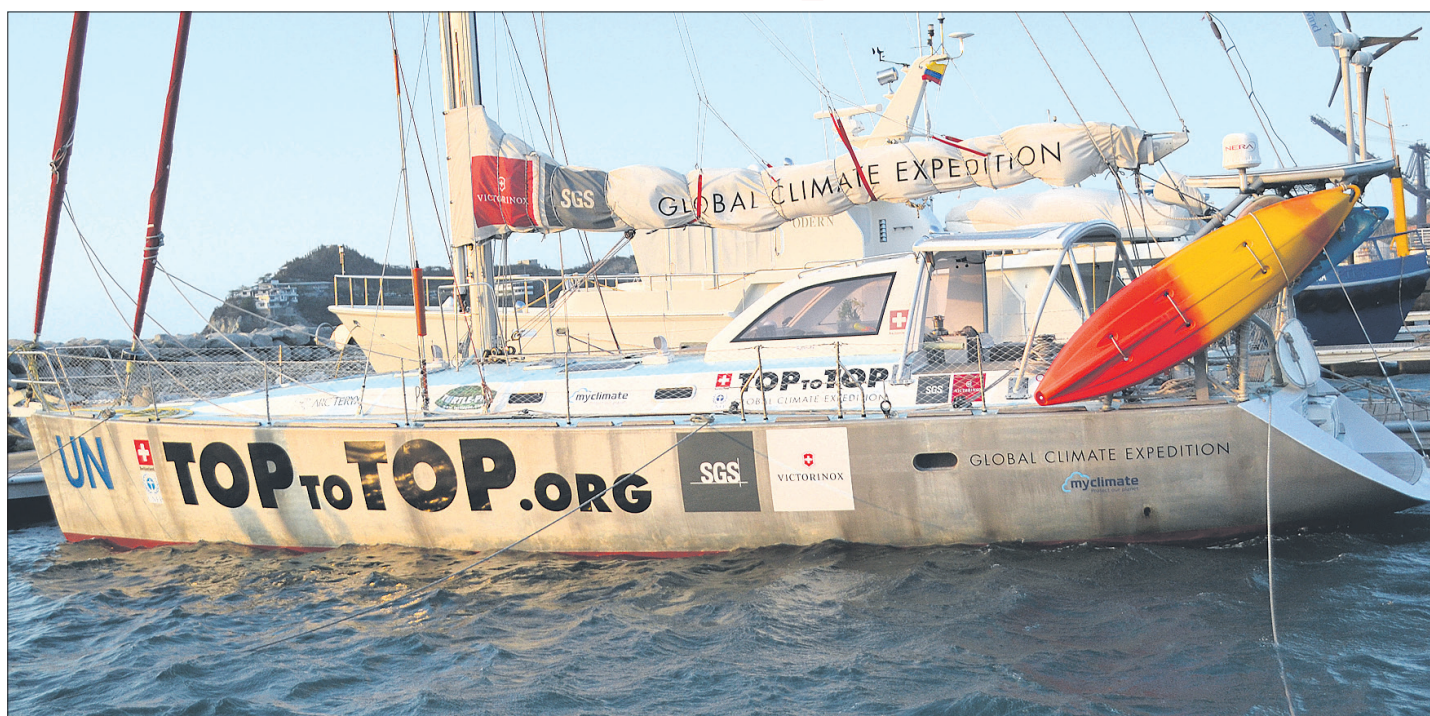
EL VELERO PACHAMAMA cuenta con paneles solares, generadores de viento, una planta desalinizadora, sistema de refrigeración, comunicaciones y navegación.

Por una semana la amable y acogedora ciudad de Santa Marta hospedó una pareja de suizos y a sus cuatro hijos que llegaron a bordo del velero Pachamama, una embarcación ecológica que se mueve por energía muscular