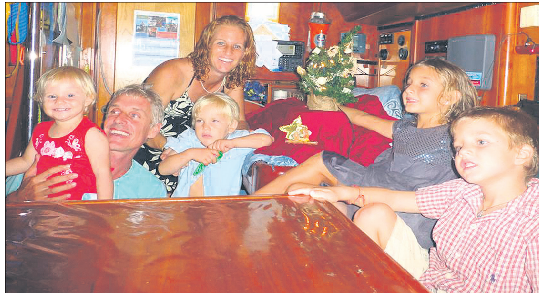
LOS CUATRO HIJOS DE LA PAREJA de expedicionarios nacieron a lo largo de este recorrido por los siete mares, son de distintas nacionalidades y comparten con sus padres las experiencias vividas en cada país que visitan.