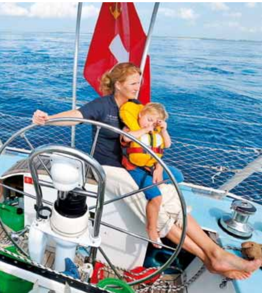
An Deck des 15-Meter-Bootes «Pachamama» liegt zwischen Ruhe und Arbeit manchmal nur ein heftiger Windstoss.