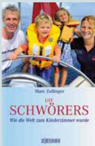
Marc Zollinger. Die Schwörers. Wie die Welt zum Kinderzimmer wurde 280 Seiten. Wörterseh Verlag

Der Autor Marc Zollinger erzählt die ersten sieben Jahre dieses grossen Abenteuers so, dass schnell klar wird, wer will, wer wirklich will, der kann die Sterne vom Himmel holen und sie auf der Erde zum Funkeln bringen.